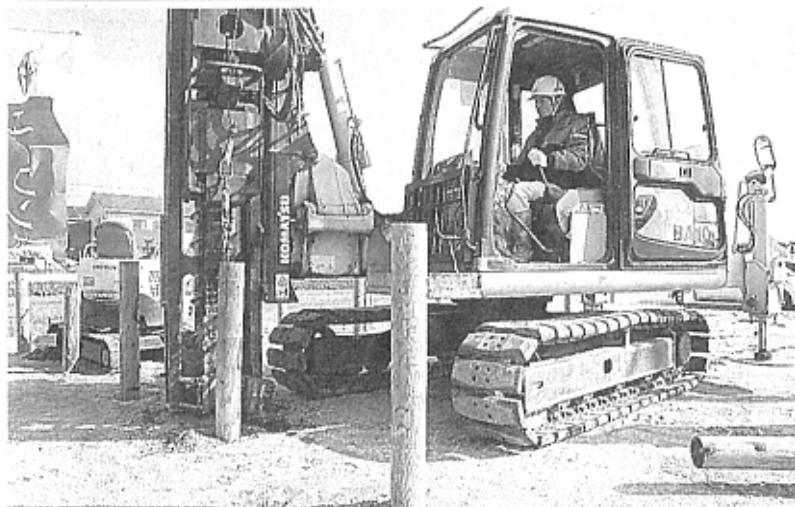
防腐・防蟻処理を施した円柱状の木くいを地中に入れる作業員。鉄鋼やコンクリートを使った地盤補強に比べ、環境負荷が低減できるという＝熊本市